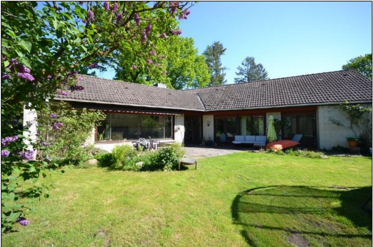
Blick von der Terrasse in den Garten