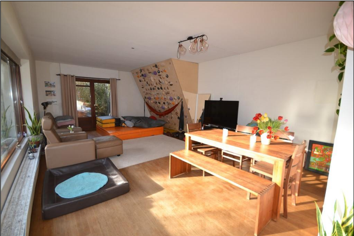
Wohnbereich (aktuell mit Kletterwand)