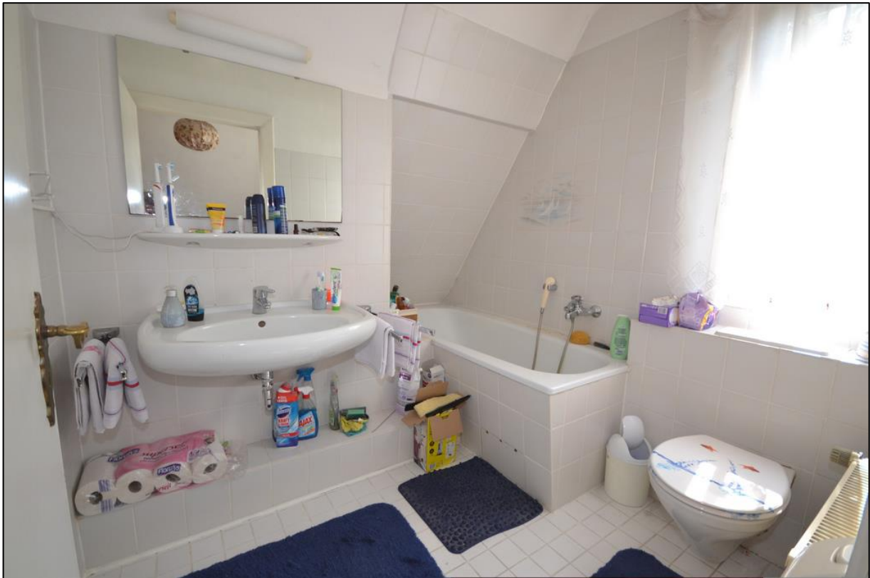
Kleines Badezimmer mit Duschbad (Haus 1)